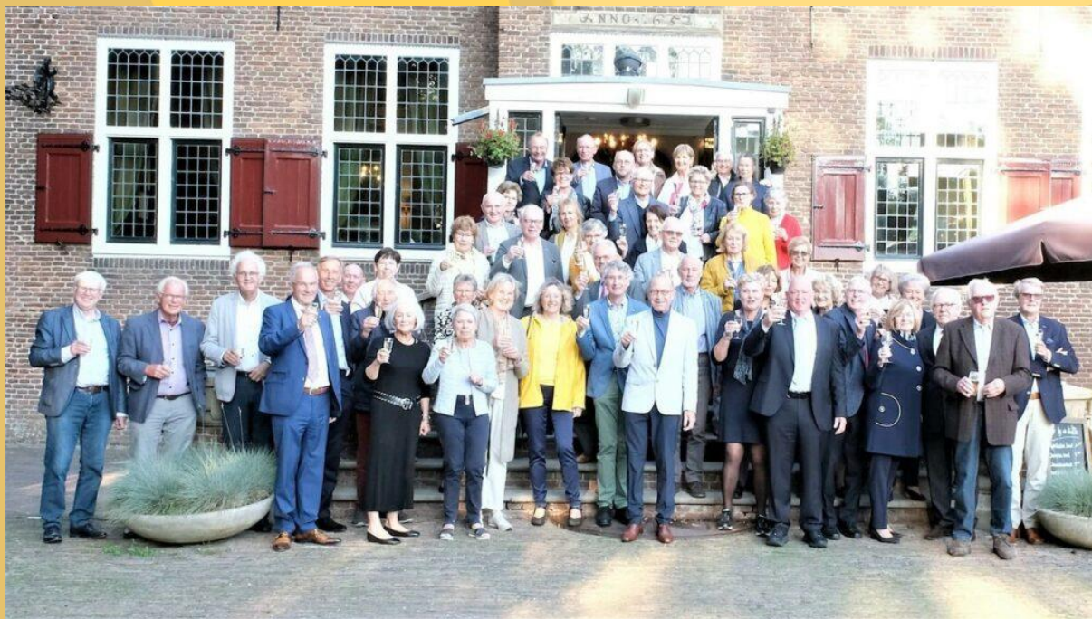
Probusclub Wesel Dinslaken op bezoek in Harderwijk

Orgelconcert in der Großen Kirche von Harderwijk. Zum krönenden Abschluss aßen alle gemeinsam zu Abend im Schloss De Essenburgh.